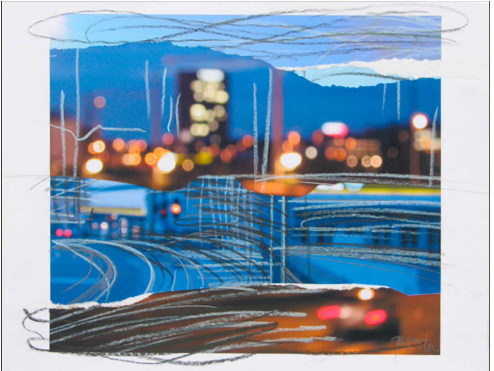
Night Life , 2006 Stifte über Collage auf Papier, 24 x 33 cm, WVZ 821-07