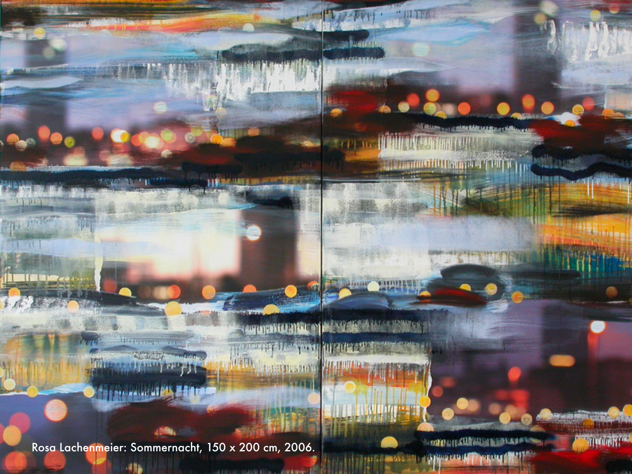
Rosa Lachenmeier: Sommernacht, 150 x 200 cm, 2006.