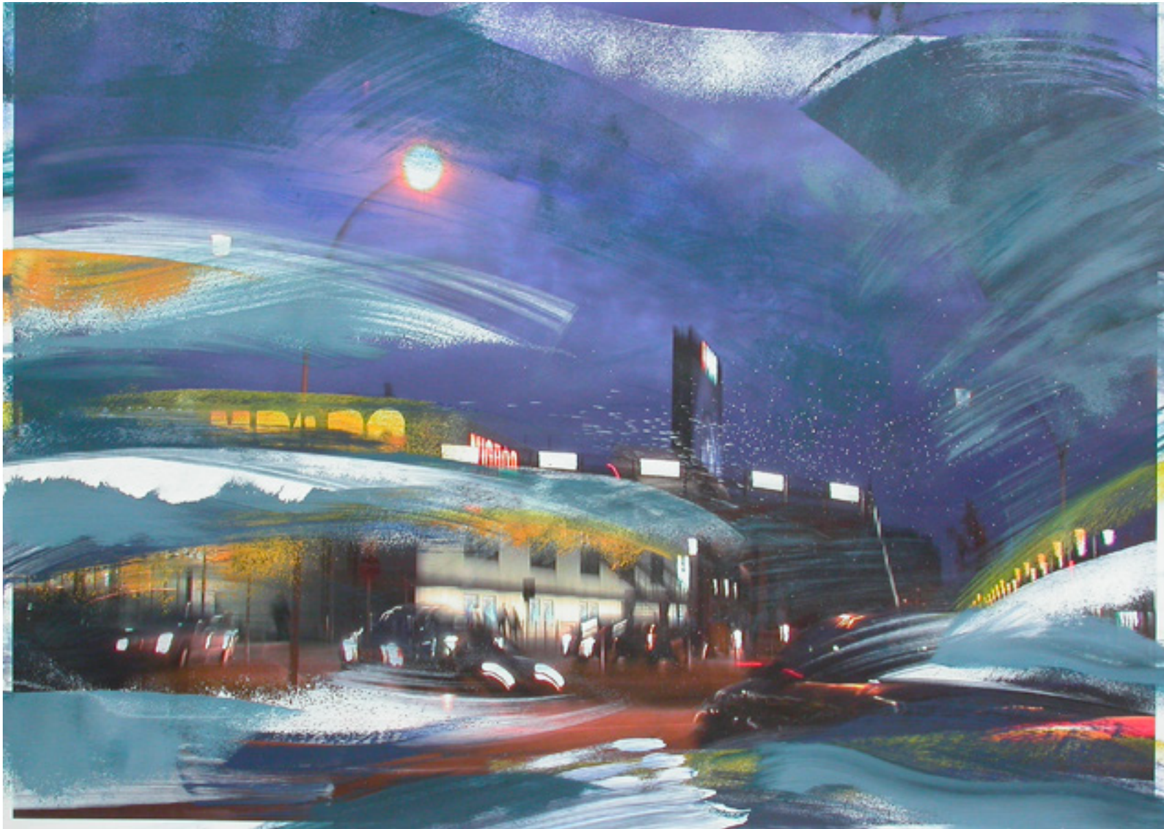
Nachtfahrt , 2006 Acryl über Fotografie auf Papier 50 x 70 cm, WVZ 766