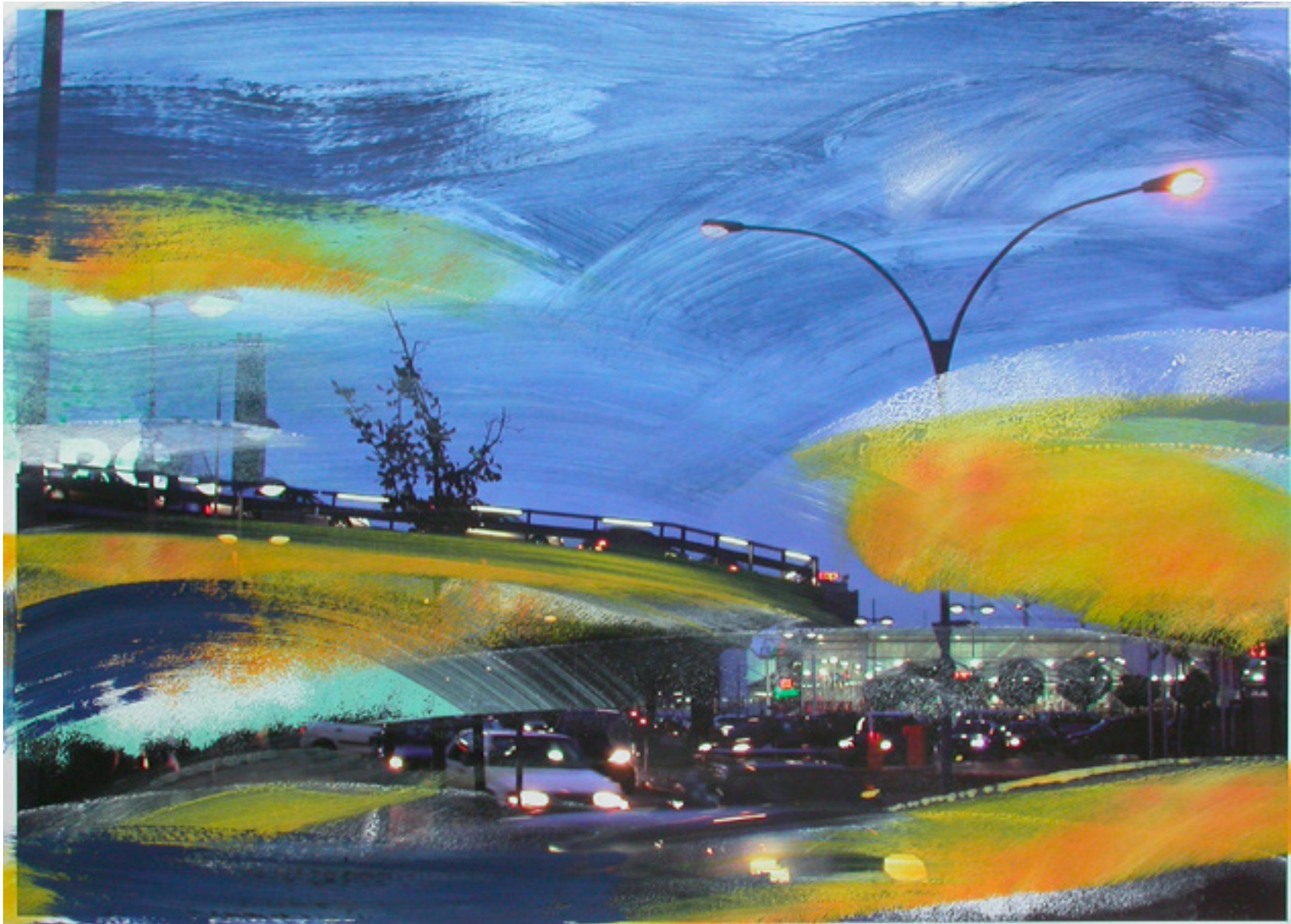
Nachtfahrt , 2006 Acryl über Fotografie auf Papier 50 x 70 cm, WVZ 765