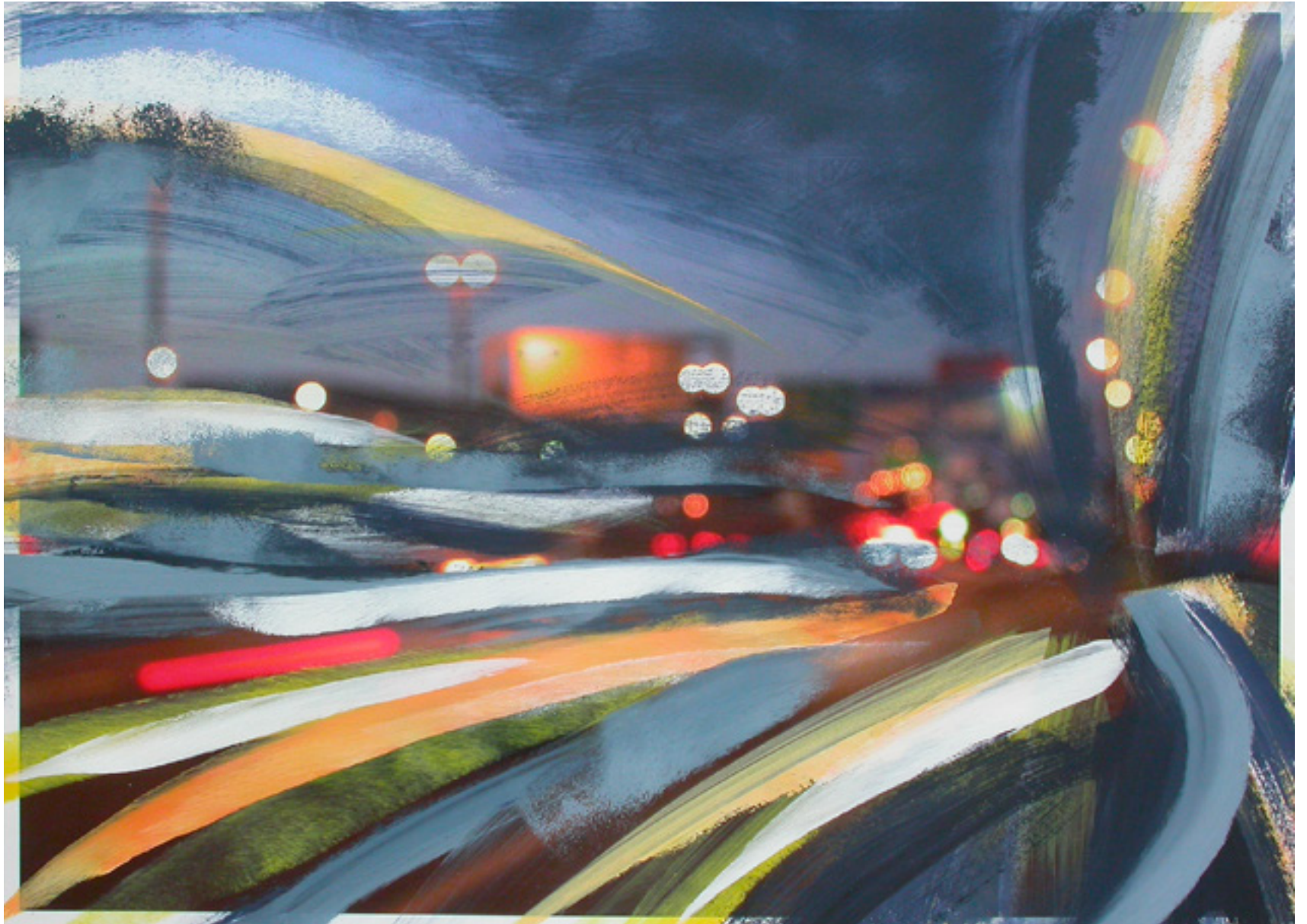
Nachtfahrt , 2006 Acryl über Fotografie auf Papier 50 x 70 cm, WVZ 762