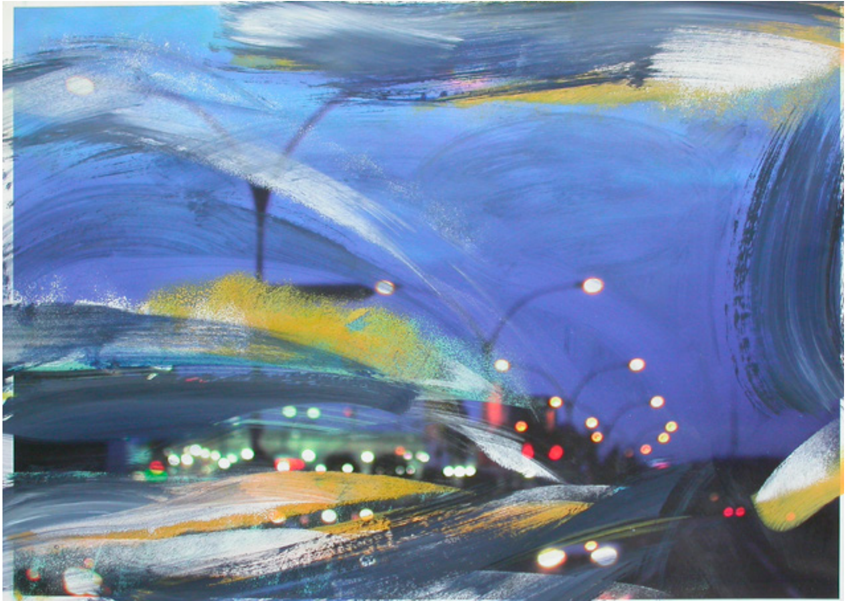
Nachtfahrt , 2006 Acryl über Fotografie auf Papier 50 x 70 cm, WVZ 764