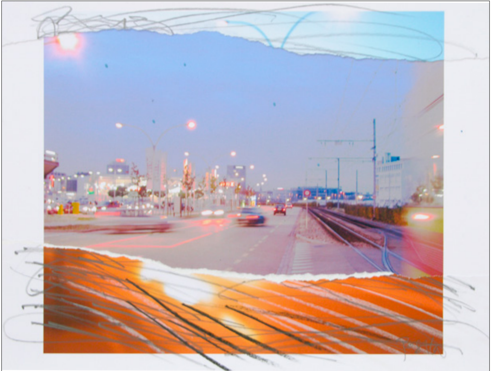
Night Life , 2006 Stifte über Collage auf Papier, 24 x 33 cm, WVZ 821-13