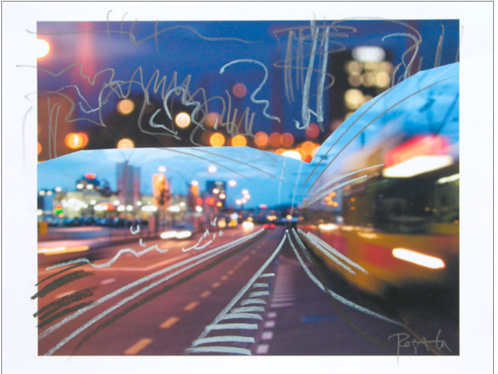
Night Life , 2006 Stifte über Collage auf Papier, 24 x 33 cm, WVZ 821-16