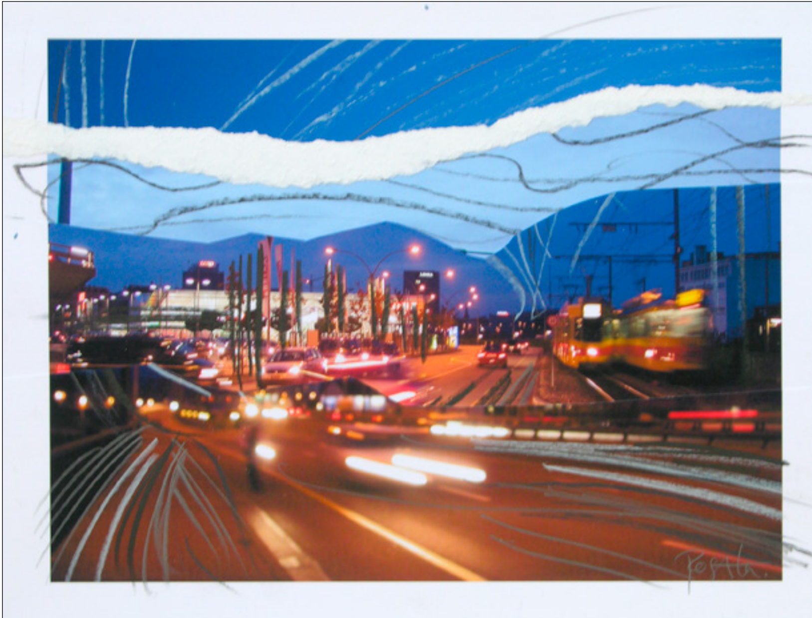
Night Life , 2006

Stifte über Collage auf Papier, 24 x 33 cm, WVZ 821-10