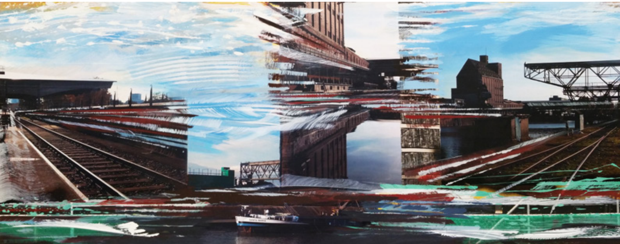
SANTA MARIA | WVZ: 1241 50 x 130 cm, 2015 Acryl, Spray, Fotografie auf Leinwand