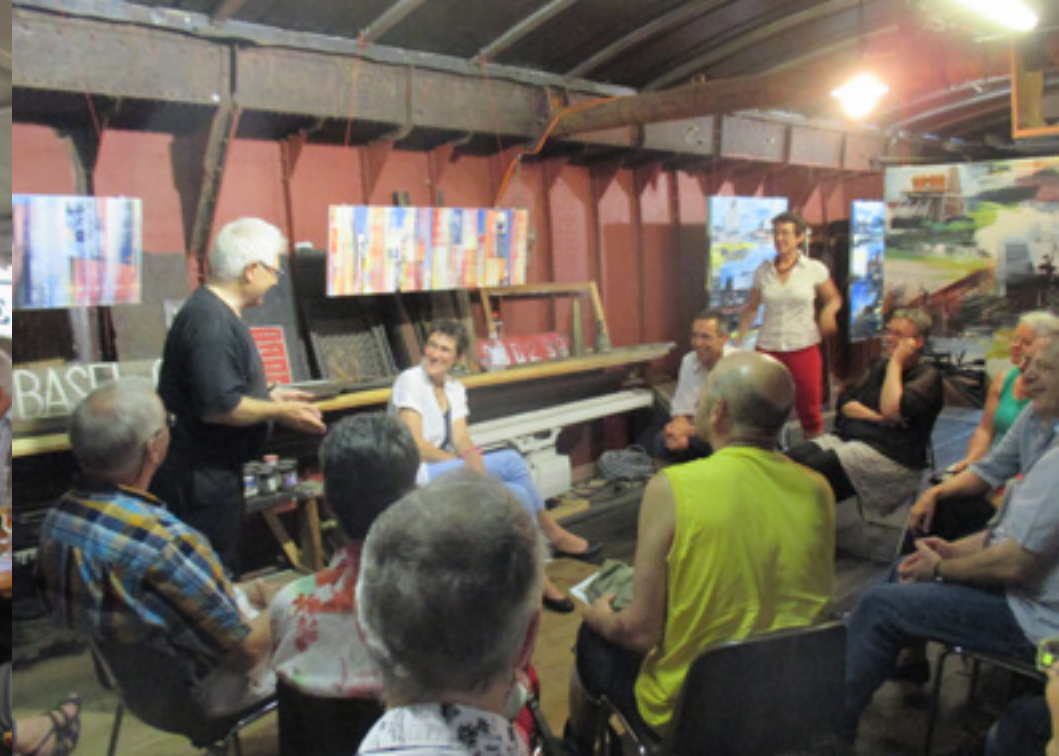
Lesung Literarische Flussfahrten