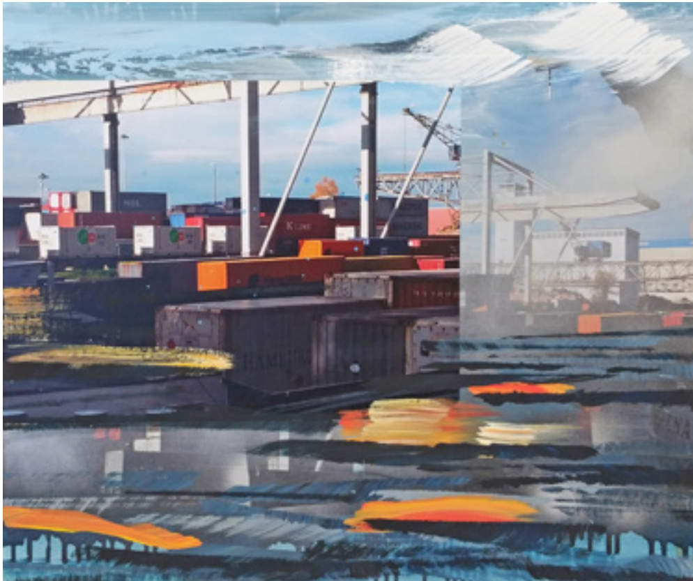
Container Area | WVZ: 1256 50 x 60 cm, 2015 Acryl, Spray, Fotografie auf Leinwand