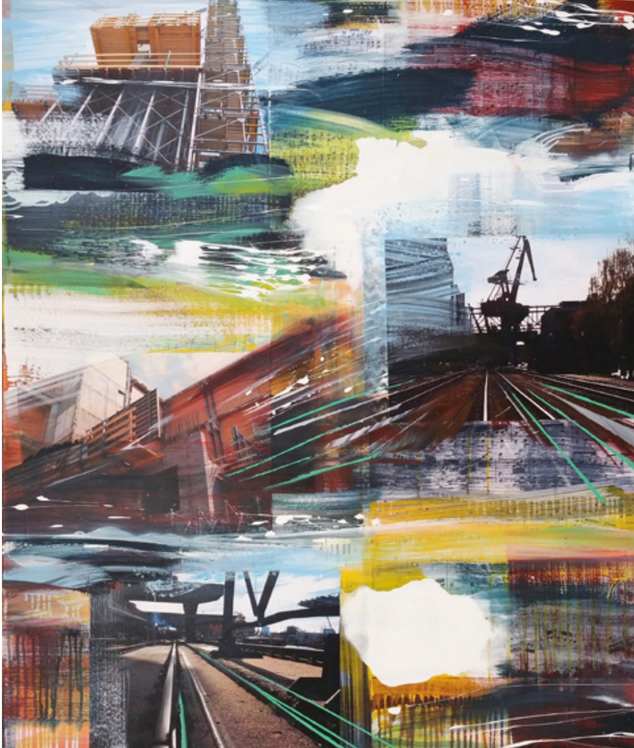
Hafenkran | WVZ: 1247 120 x 100 cm, 2015 Acryl, Spray, Fotografie auf Leinwand