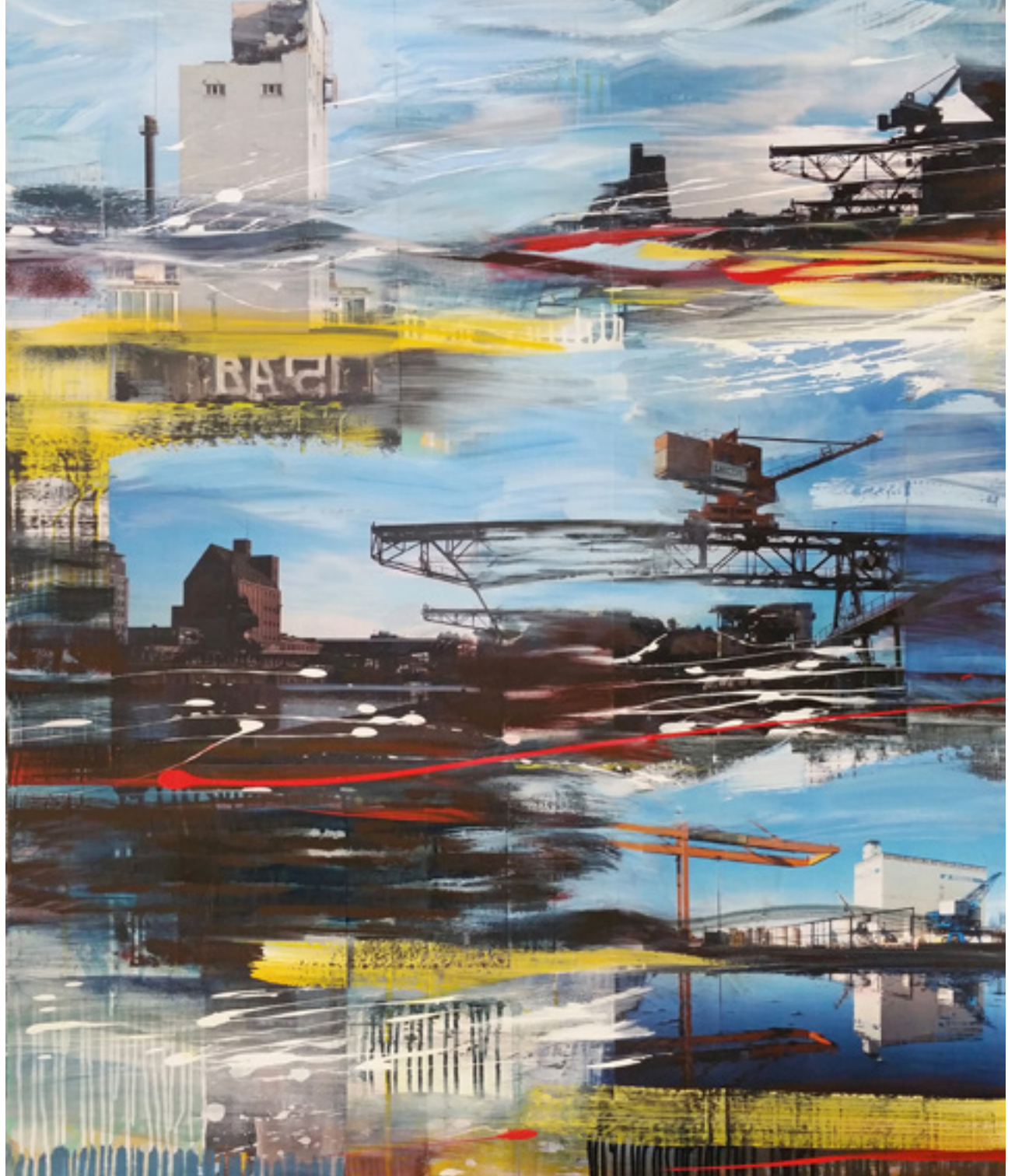
Hafenansicht | WVZ: 1246 120 x 100 cm, 2015 Acryl, Spray, Fotografie auf Leinwand