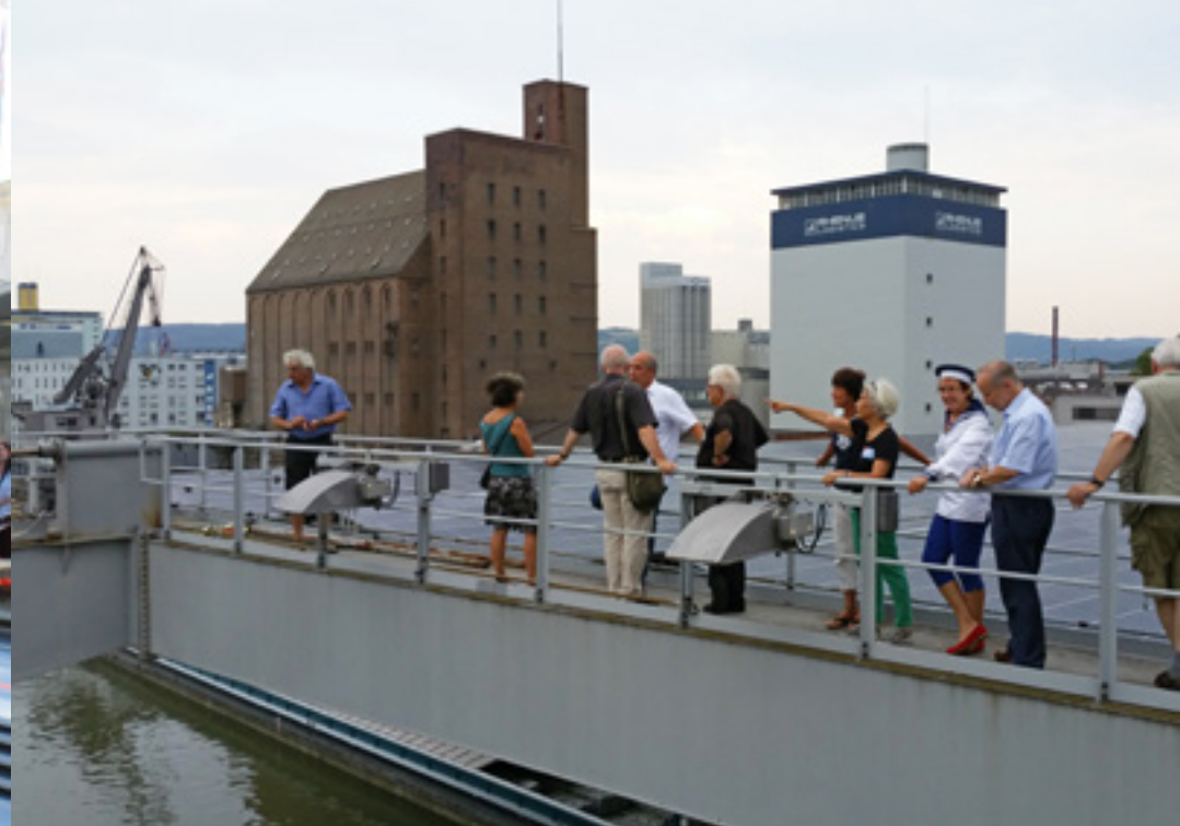
Führung auf dem Containerkran