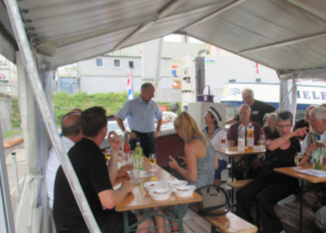
Finissage mit dem Hafendirektor