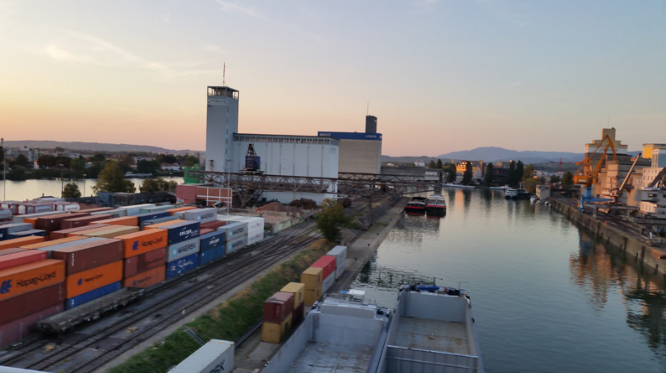
Rheinhafen Basel, 2015

Rosa Lachenmeier, MAGIC – Rheinhafenbilder im Schiff Willi, Basel, 2. – 13. August 2015