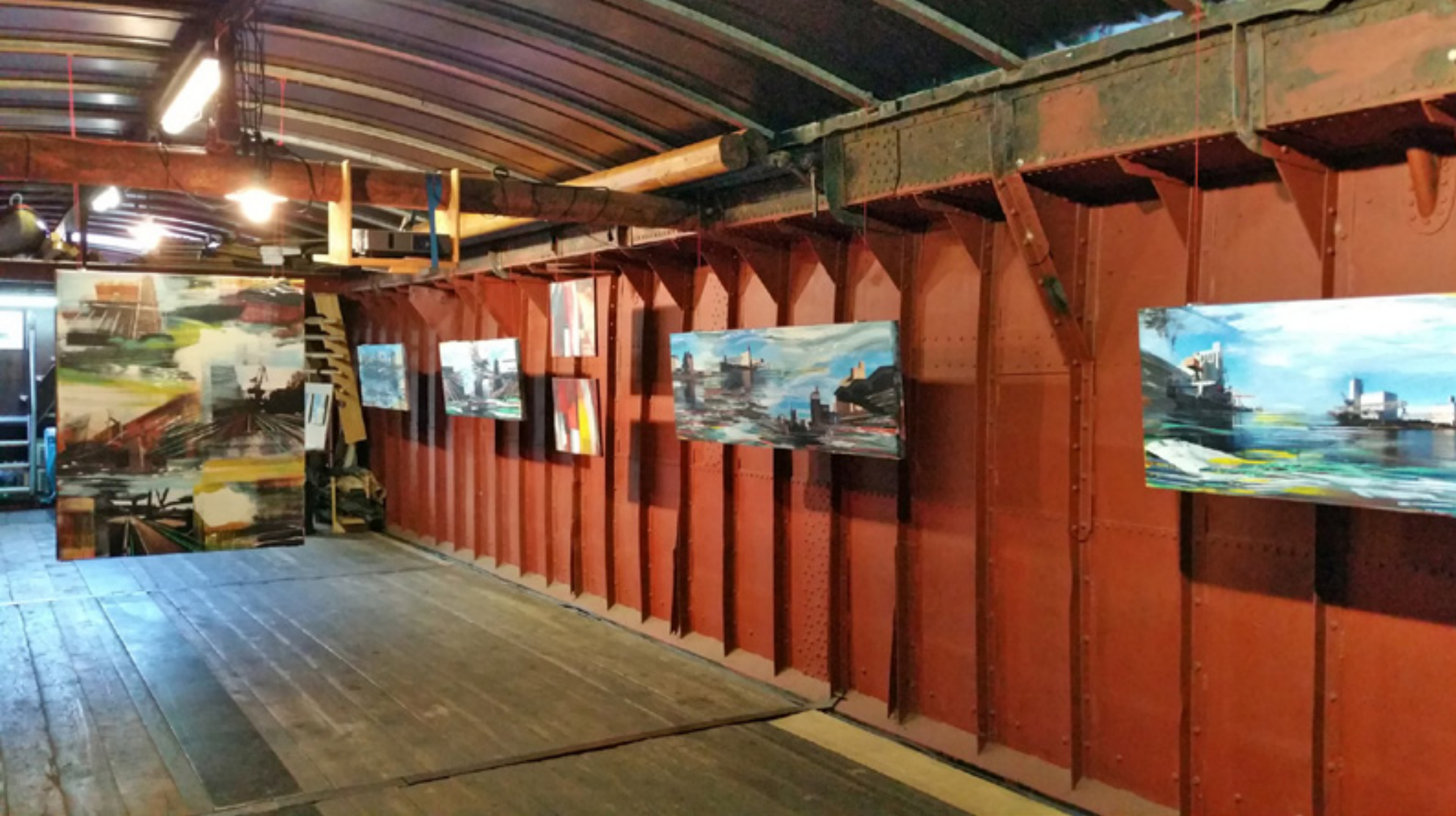
MAGIC – Ausstellung im Schiff Willi Rheinhafen Basel, 2015