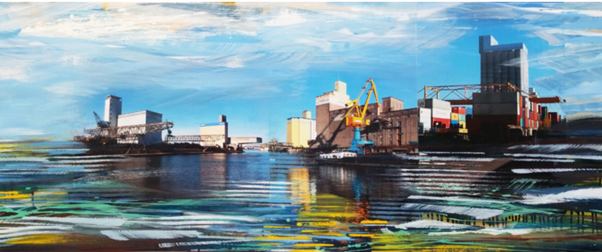
Hafenbecken 7 | WVZ: 1242 50 x 160 cm, 2015 Acryl, Spray, Fotografie auf Leinwand Privatsammlung, Basel