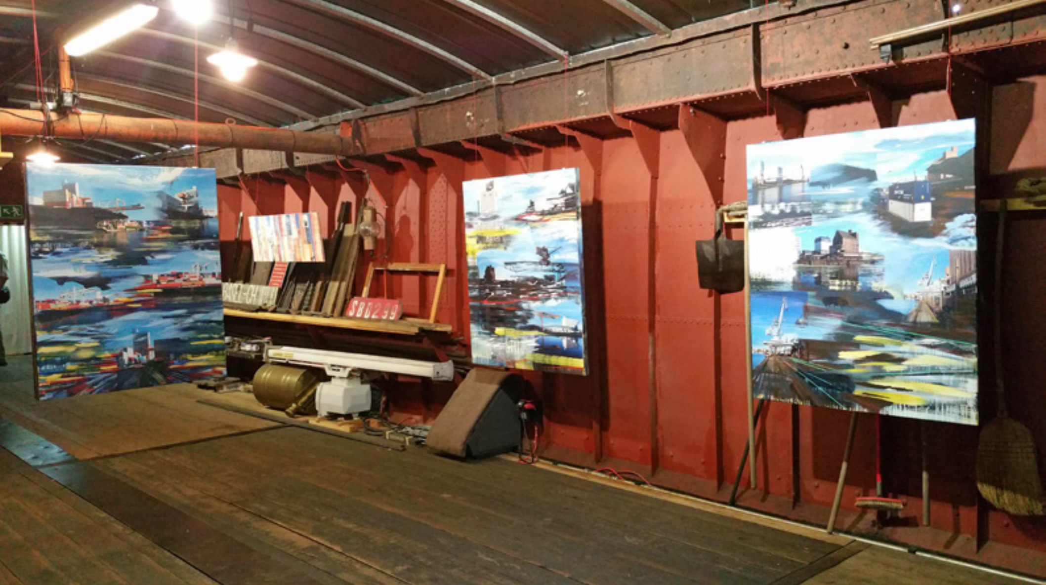
MAGIC – Ausstellung im Schiff Willi Rheinhafen Basel, 2015