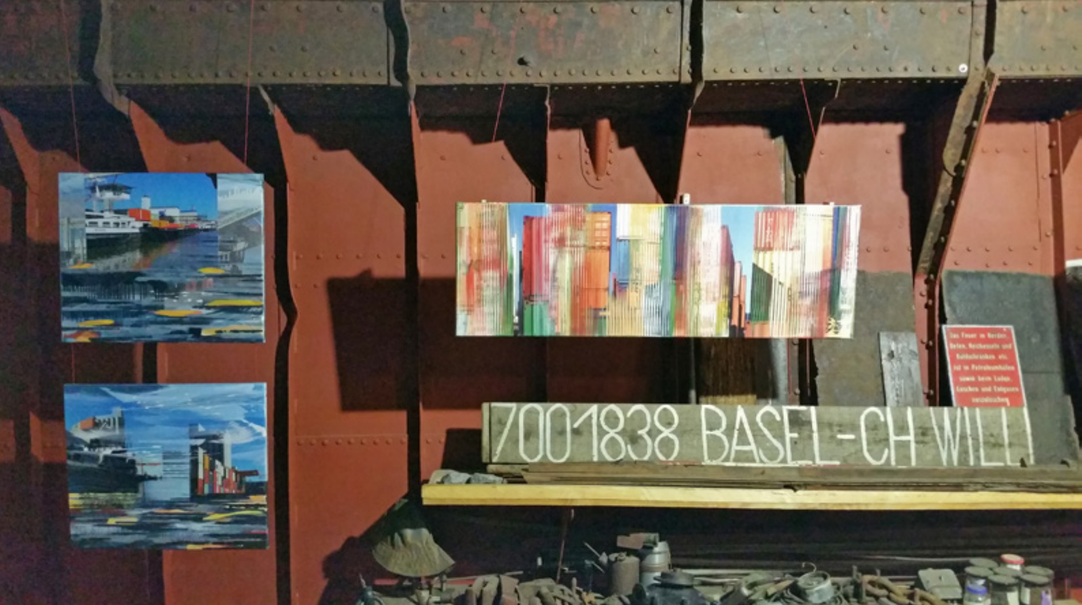
MAGIC – Ausstellung im Schiff Willi Rheinhafen Basel, 2015