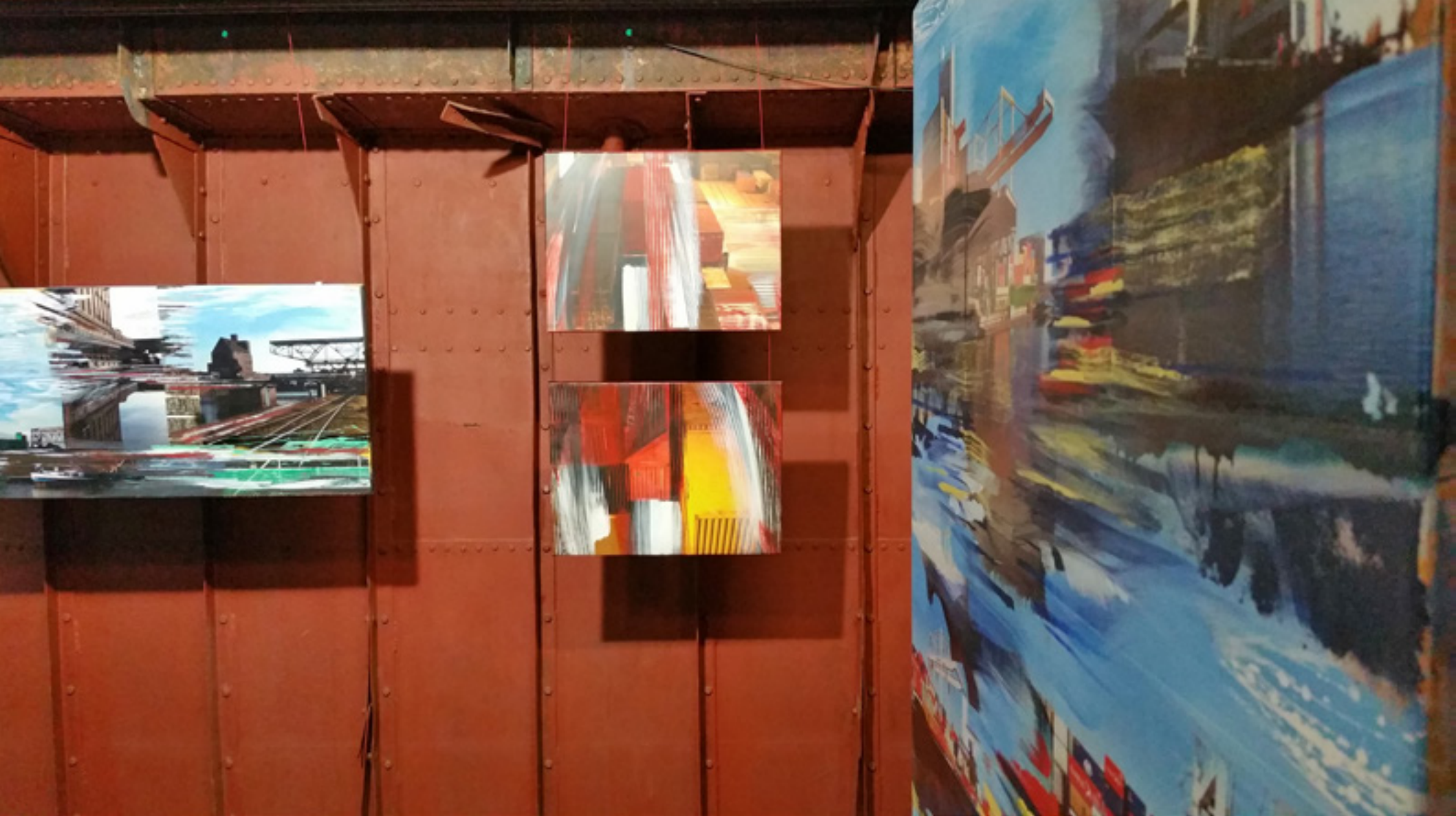
MAGIC – Ausstellung im Schiff Willi Rheinhafen Basel, 2015