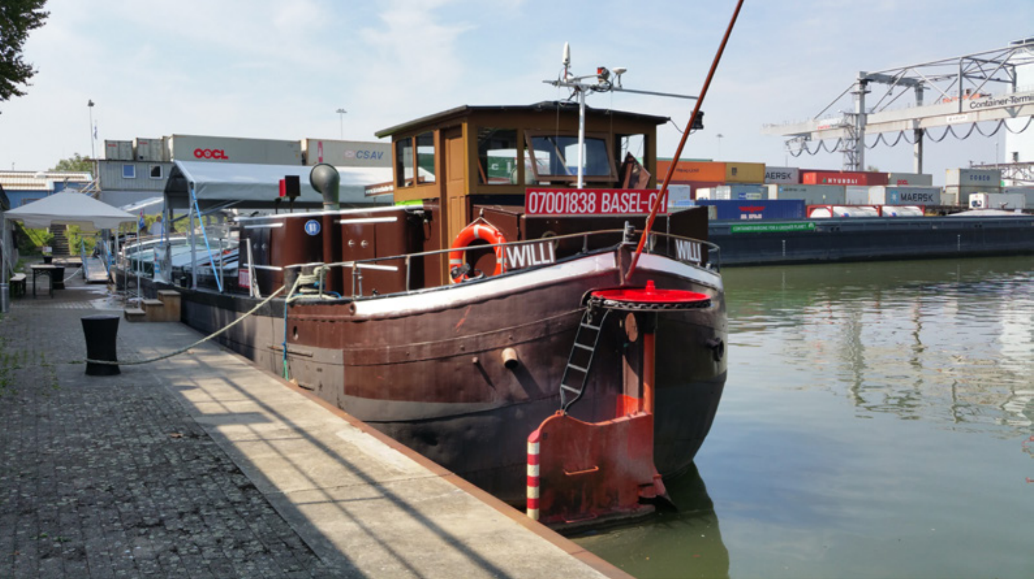
Die Péniche Willi im Rheinhafen Basel, 2015