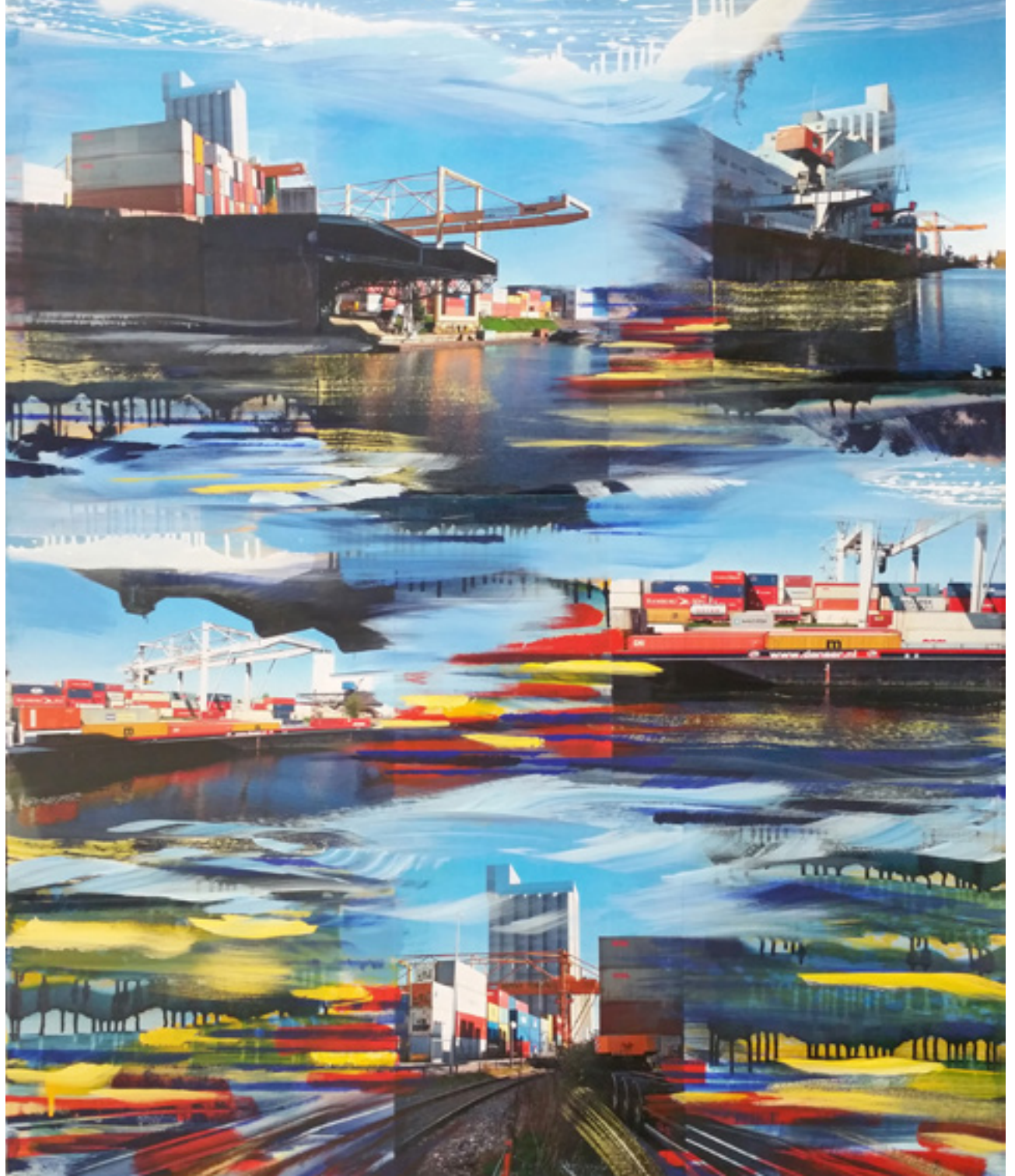
Container Area | WVZ: 1248 120 x 100 cm, 2015 Acryl, Spray, Fotografie auf Leinwand