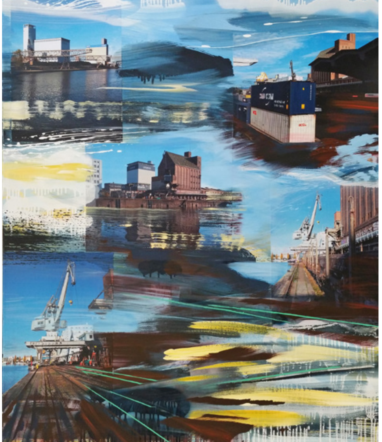
Hafenansicht | WVZ: 1249 120 x 100 cm, 2015 Acryl, Spray, Fotografie auf Leinwand