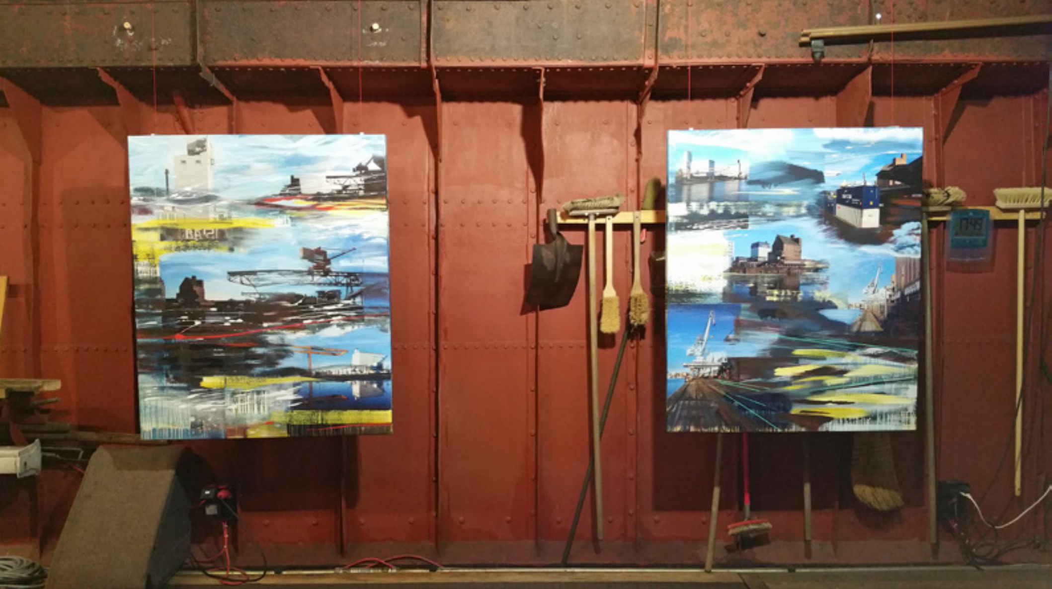
MAGIC – Ausstellung im Schiff Willi Rheinhafen Basel, 2015