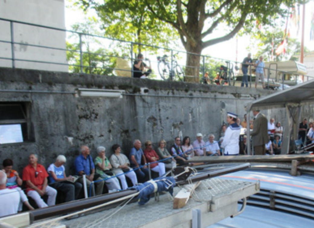
Vernissage der Ausstellung